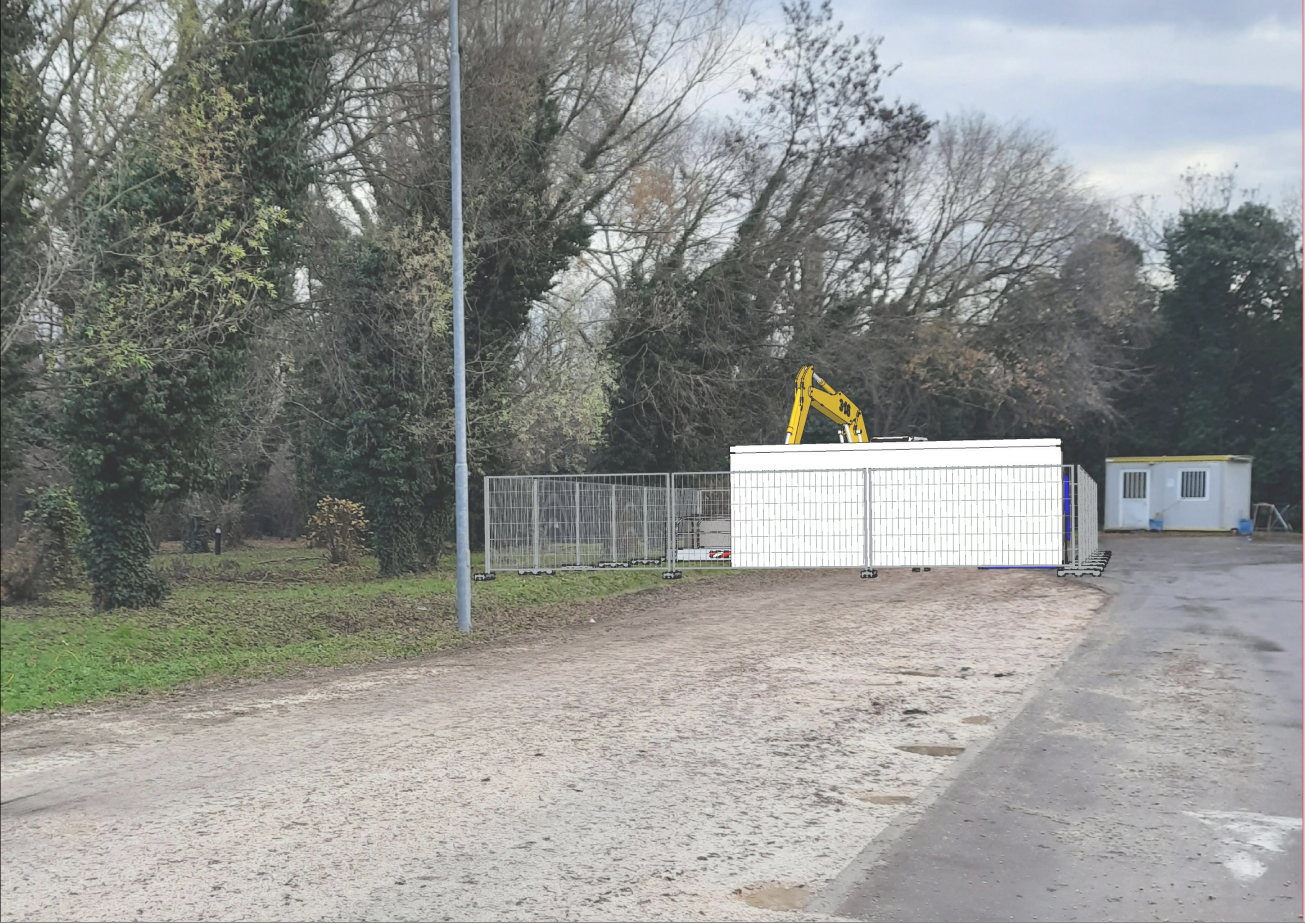
FOTOINSERIMENTO TRIDIMENSIONALE - POZZETTO DI ARRIVO 2